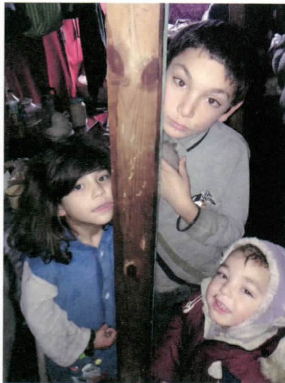
(Тимчасове ромське поселення, Дарницький район, м. Київ; 01.02.2016)

( http://www.radiosvoboda.org/a/27092174.html )